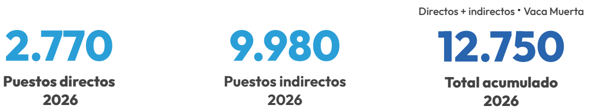
Gráfico 2. Evolución · acumulado

Creación de puestos de trabajo asociados al desarrollo gasífero en Vaca Muerta, acumulado desde el ingreso en operación del GPNK.